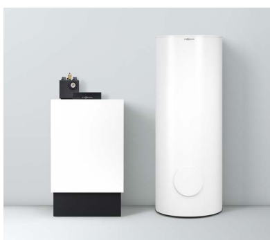
Vitoladens 300-C avec ballon d'eau chaude latéral Vitozell 300-B/-W (type EVBB-A, ballon de 300 l de capacité) – tous deux en revêtement vitopearlwhite