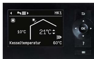
Ecran de la régulation Vitotronic avec affichage en texte clair et menus structurés

Avec Vitoconnect et un smartphone, le pilotage des installations de chauffage Viessmann est un jeu d'enfant. Les installations de chauffage peuvent être commandées via l'application ViCare. Toutes les applications Viessmann sont disponibles pour les supports mobiles sous iOS ou Android.