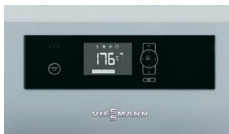
Régulation Ecotronic 100 à écran rétro-éclairé pour une utilisation simple et intuitive

Avec un fonctionnement modulant, la chaudière Vitoligno 150-S s'adapte en continu au besoin calorifique du moment. La régulation de combustion avec sonde lambda et sonde de fumées mesure en permanence la teneur en oxygène et la température des fumées. Elle assure une combustion propre et de faibles émissions polluantes et garantit un rendement maximal élevé jusqu'à 93,1 %. De façon économique, la chaudière Vitoligno 150-S transforme ainsi les bûches de bois en chaleur utile.