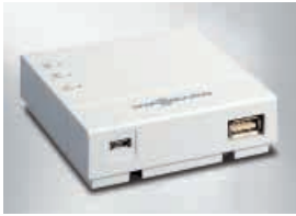
Vitoconnect 100 avec branchements pour le bloc d'alimentation (à gauche) et pour la liaison de données

L'application mobile ViCare propose de nouvelles fonctionnalités de pilotage à distance des installations de chauffage. Elle a été spécialement développée pour le particulier.