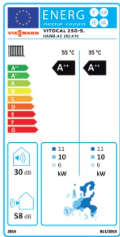
Classe d'efficacité énergétique A++ pour la Vitocal 250-S HAWB-AC 252.A10

Dans un contexte où la fluctuation du prix des énergies pèse sur votre budget chauffage : Viessmann propose un nouveau concept alliant confort et économies qui répond à cette problématique.