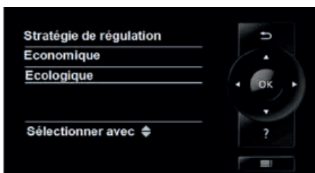
Régulation Vitotronic 200 avec Hybrid Pro Control