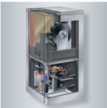
Vitocal 350-A pour installation intérieure