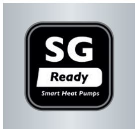
Label pour pompe à chaleur raccordable aux réseaux électriques intelligents