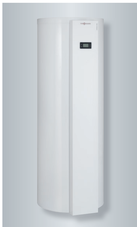
Ballon thermodynamique Vitocal 060-A

Pour réaliser davantage d'économies la régulation du Vitocal 060-A est combinable avec une installation photovoltaïque. En fonction des régions françaises, avec seulement 4 capteurs, la production d'électricité verte peut vous faire économiser jusqu'à 25 % supplémentaires sur votre facture d'électricité.