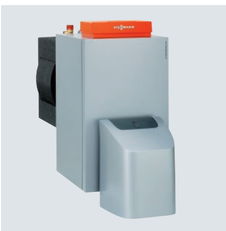
Vitorondens 200-T de 67,6 à 107,3 kW