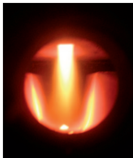
Vitoligno 100-S technique de gazéification

La chaudière à gazéification Vitoligno 100-S est idéalement conçue pour un fonctionnement "bivalent" (chauffage et eau chaude sanitaire), en association avec une chaudière fioul ou gaz.