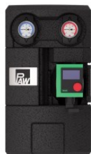
Modules hydrauliques et accessoires