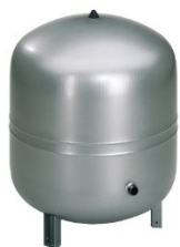
Vases et accessoires