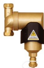
Dégazeurs et débourbeurs