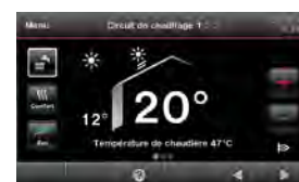
Régulation Vitotronic 200

Selon modalités en cours, rendez-vous sur www.viessmann.fr