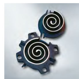
Compresseur de pompes à chaleur

Selon modalités en cours, rendez-vous sur www.viessmann.fr