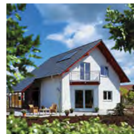
Capteurs solaires thermiques Vitosol

Selon modalités en cours, rendez-vous sur www.viessmann.fr