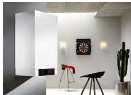
Chaudière fioul haute performance Vitoladens 300-W

En 2016, Viessmann a lancé deux nouvelles chaudières haute performance fioul la Vitoladens 300-W et Vitoladens 333-F avec production d'eau chaude sanitaire intégrée, elles sont spécialement conçues pour fonctionner avec un fioul très basse teneur en soufre qui préservera votre installation et votre environnement en limitant les rejets polluants.