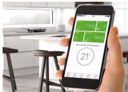
Pilotage à distance par smartphone

La régulation Vitotronic 200, à l'usage intuitif, peut être reliée à Internet grâce à l'interface Vitoconnect. Vous pouvez ainsi piloter votre système de chauffage à distance avec l'application ViCare : choisissez votre programme de fonctionnement ou modifiez à votre guise les réglages de température.