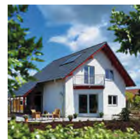
Capteurs solaires thermiques Vitosol

Selon modalités en cours, rendez-vous sur www.viessmann.fr