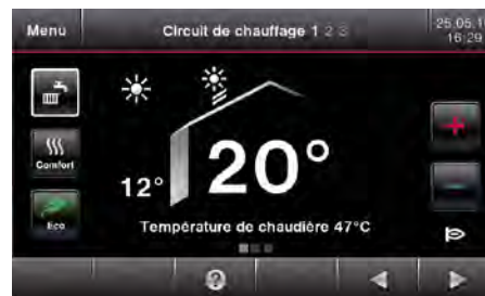
Régulation Vitotronic 200

Restez connecté grâce à la nouvelle régulation en fonction de la température extérieure et son écran tactile couleur qui vous offrira un confort d'utilisation optimale. Pilotez à distance votre installation de chauffage via votre smartphone ou tablette grâce à l'application ViCare. Visualisez les gains grâce au solaire, choisissez votre programme de fonctionnement, modifiez à votre guise les réglages de température.