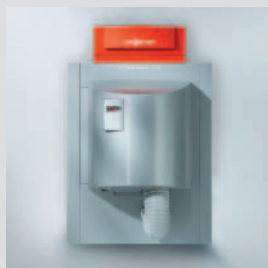
1 chaudière gaz à condensation Vitocrossal 200 311 kW