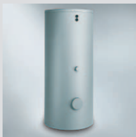
1 ballon Vitocell 100-B 500 litres