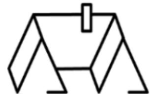
À plusieurs ailes

Année de construction : ..... Surface habitable chauffée : .....m 2