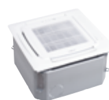
Cassette de plafond