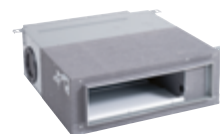
Unité intérieure pour montage en gaine, pression de refoulement moyenne