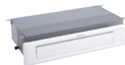
Unité intérieure pour montage en gaine, basse pression de refoulement, avec panneau/couvercle de protection