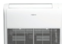
Unité intérieure pour montage au sol ou au plafond