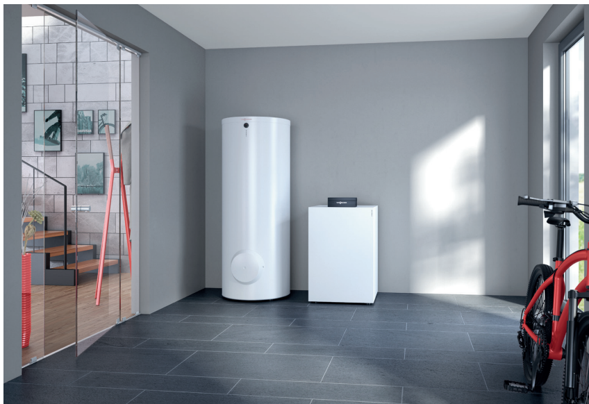
Pompe à chaleur Vitocal 200-G avec ballon d'eau chaude sanitaire Vitocell 100-W (à gauche)

La pompe à chaleur Vitocal 200-G eau glycolée / eau, grâce à son fonctionnement silencieux, peut trouver facilement place à proximité des espaces de vie