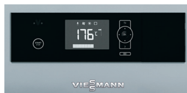
Régulation Ecotronic 100 à écran rétro-éclairé pour une utilisation simple et intuitive

L'aspiration des gaz de distillation réduit la présence de fumées lors du chargement des bûches. Un levier permet le nettoyage facile des surfaces d'échanges. A l'intérieur de la cuve, les bûches de bois se transforment en braises. Les gaz formés sont aspirés, pour être enrichis en oxygène et brûlés à des températures élevées pour réduire à leur minimum les dégagements polluants. Une butée de porte d'un côté ou de l'autre permet une utilisation optimale de l'espace et une installation en angle dans un local.