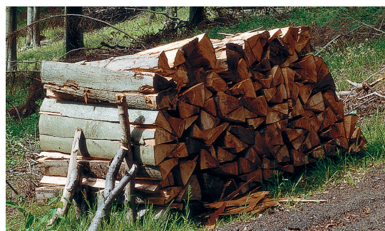
Le chauffage au bois - le combustible le plus naturel au monde

De façon économique, la chaudière Vitoligno 150-S transforme ainsi les bûches de bois en chaleur utile.