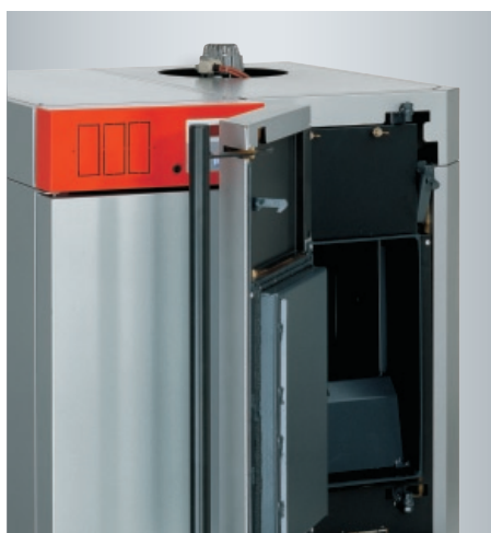
Cuve de chargement en acier inoxydable spécial