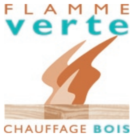
Label "Flamme Verte"

La Vitolig 200 est une chaudière bois performante. Sa cuve de chargement en acier inoxydable peut recevoir des bûches jusqu'à 50 cm de longueur. Elle peut également brûler des plaquettes de bois déchiqueté et des briquettes de bois.