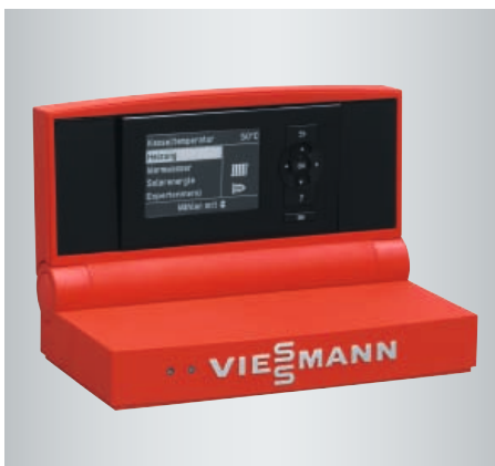
Régulation Vitoltronic avec menu déroulant clairement structuré