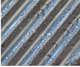
Surfaces d'échange Inox-Crossal en acier inoxydable austénitique