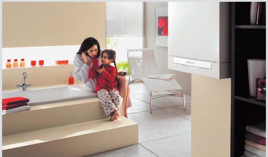
Vitodens 300 : une chaudière gaz à condensation au design élégant et aux formes compactes pour s'adapter parfaitement à votre intérieur.

Dans un contexte économique où les prix de l'énergie ne cessent d'augmenter, le chauffage prend une part importante dans le budget d'une famille. Choisir aujourd'hui une solution pour votre confort en chauffage et en eau chaude sanitaire n'est donc pas un acte anodin, ni pour votre budget, ni pour la planète. Dans ce contexte il faut déjà penser à demain : innover et intégrer dans votre quotidien de nouvelles technologies telles que les chaudières au gaz naturel, favorables aux économies d'énergies et à l'environnement.